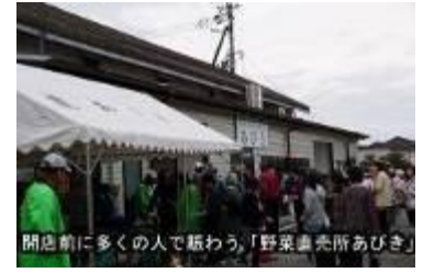
開店前に多くの人で賑わう、「野菜直売所あびき」

前には多くの 方が集まり、 粗品進呈の予 約券百枚が無 くなつてしま うほどの賑わ いでした。