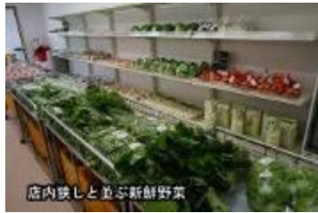
店内映しと並ぶ新鮮野菜

店内には九会の農の匠より集 めたこだわりの新鮮野菜や加西 ブランドのトマトやイチゴ等、そ して噂の赤卵など自慢の品が勢 揃いで、皆さん、我先にと買い物 かごにいれられていました。表で