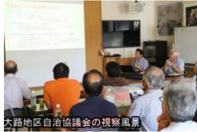
大路地区自治協議会の視察風景

まず南網引町公会堂で板井代表から理事会と区長会・各種団体との協力体制に基づく組織作り、活動指針を決めるための全世帯アンケート実施や円卓会議の開催、五つの部会を作り部会員を募集、四回の部会員会議で部会ごとの活動方針を決定、今年から活動をより活発化している」と説明しました。