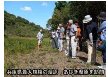
兵庫県最大規模の湿原 あびき湿原を訪問

から、この湿原だけの貴重な動植物の話や地域住民による自主的な湿原保全活動について、説明しながら楽しく案内をいたしました。